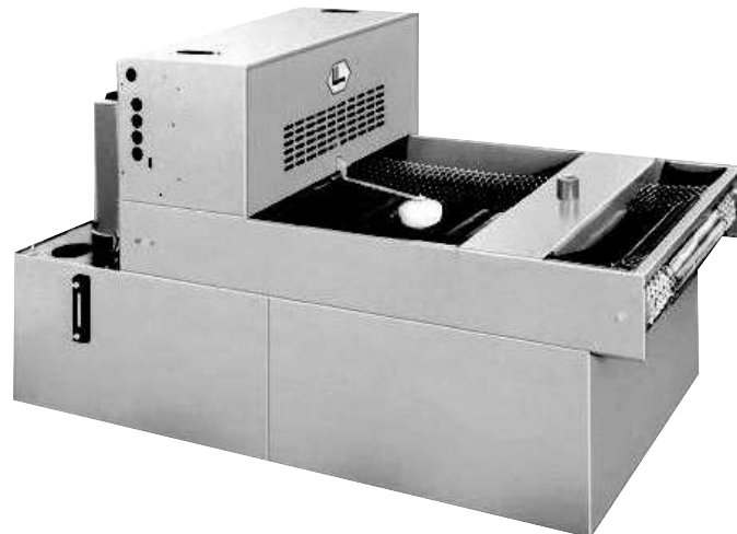
FA 02/00–FA 140/14

Von Schmutz behaftetes Filtervlies wird somit automatisch in Abhängigkeit von Menge und Undurchlässigkeit der Verunreinigungen ausgetragen. Das verschmutzte Filtervlies wird am Ende des Filterautomaten in einen Schlammkasten geleitet und kann ohne Störung des Filterprozesses entfernt werden. Durch Vorschalten einer Magnetfilterwalze werden ferritische Schmutzpartikel bereits vor Einleiten der Flüssigkeit auf den Bandfilter ausgeschieden, wodurch der Papierverbrauch bedeutend vermindert werden kann.