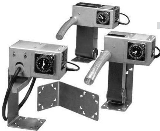
Bandskimmer band skimmer séparateur à bande