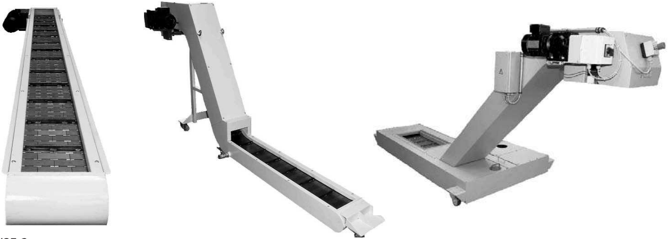
SF 1/SF 2

Convoyeurs à coupeaux avec bande charnière